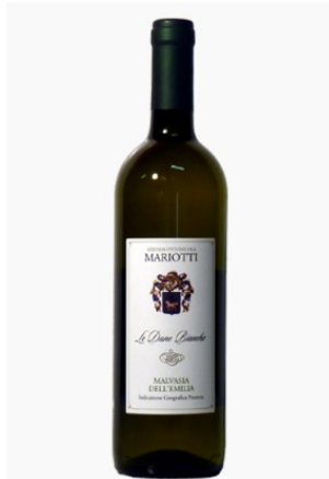
Malvasia dell'Emilia IGP fermo "Le Dune Bianche"