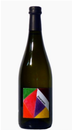
Bianco dell'Emilia IGP frizzante "Smarazen"