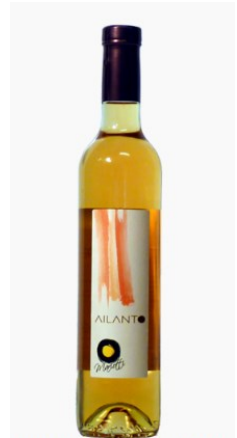
Vino da Uve stramature Bianco "Ailanto"