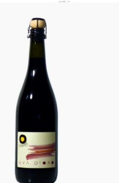
Fortana dell'Emilia IGP frizzante "Uva d'Oro"